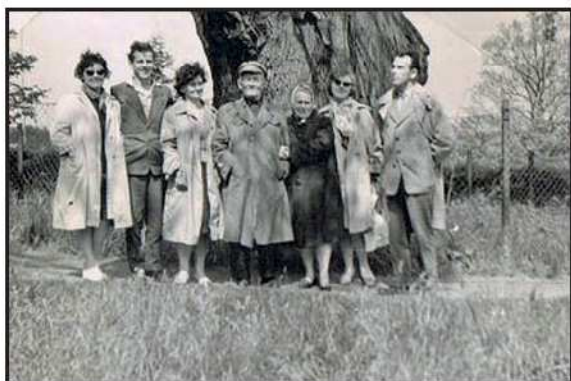
Kierownik szkoły w środku i grono nauczycieli. Rok 1962.