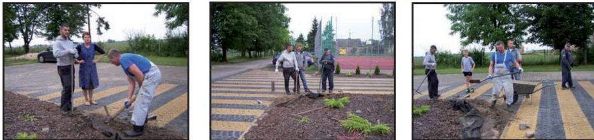
25 czerwca 2014 r. – wykonanie obrzeży wokół klombu przed budynkiem szkoły.