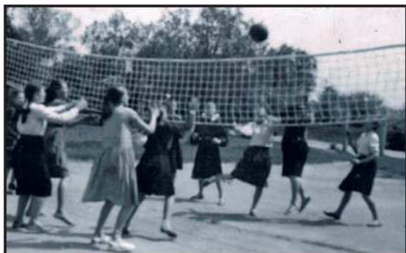
Rok 1957 – lekcja wychowania fizycznego – kl. VII – gra w piłkę siatkową na boisku szkolnym.