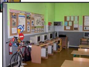
Odnowiona sala matematyczno-komputerowa.