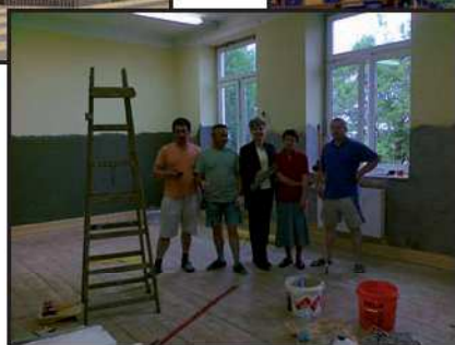
Remont sal lekcyjnych czerwiec 2013 r.