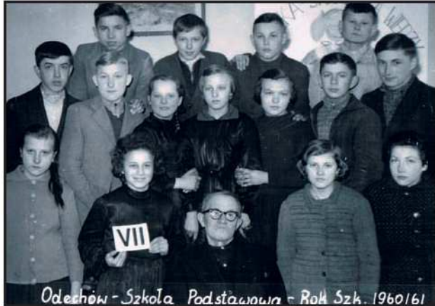
Odechów - Szkoła Podstawowa - Rok Szk. 1960/61