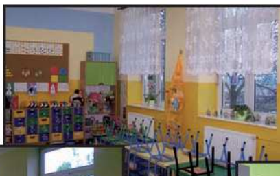
Odnowiona sala oddziału przedszkolnego.