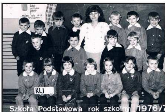
Szkoła Podstawowa rok szkolny 1976/77