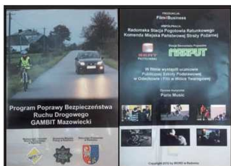
15.10.2012 r. – realizacja spotu reklamowego promującego bezpieczne zachowania w ruchu drogowym.

Propagujemy bezpieczeństwo między innymi poprzez organizowanie corocznie we współpracy z WORD w Radomiu i Komendą Wojewódzką Policji w Radomiu Międzyszkolnego Turnieju Bezpieczeństwa w Ruchu Drogowym czy Dnia Szkoły bez Przemocy.