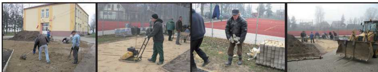
15 listopada 2012 r. – układanie kostki brukowej przed wejściem do budynku szkolnego.

Część prac sfinansowano z budżetu szkoły i dzięki sponsorom, ale aż taki ich zasięg nie byłby możliwy, gdyby nie ogromny wkład Rodziców (a nawet Dziadków). Wszyscy pomagali w odnawianiu i urządzeniu sal lekcyjnych poszczególnych klas – wiele działań także finansując.