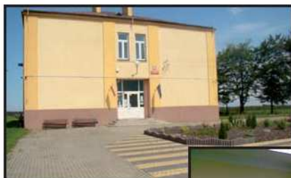
Zagospodarowany teren przed szkołą 12 sierpnia 2014 r.