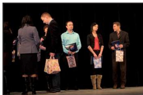
2012 r. – I miejsce za realizację programu „Bezpieczna Szkoła”.

Spot realizowany był na zlecenie Wojewódzkiego Ośrodka Ruchu Drogowego w Radomiu oraz Starostwa Powiatowego w Radomiu. Partnerzy kampanii to: Komenda Miejska Policji w Radomiu, Radomska Stacja Pogotowia Ratunkowego, Państwowa Straż Pożarna, Stacja Złomowania Pojazdów Marut oraz SEAT Piotrowski. Film trafił do wszystkich szkół byłego powiatu radomskiego.